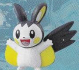
M-028 ※5月下じゅんはつ売よてい