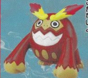
M-030 ※6月中じゅんはつ売よてい