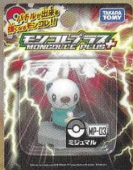
モンコレプラス (M) (C) 2010 TAKARA TOMY

フィギュアには、HP・わざなどのいろいろな「のう力」が、ぎっしりつまっているぞ! その「のう力」をつかって、ポケモンバトルをすることができるのだ!! バトルのポーズがかっこいいぞ!!